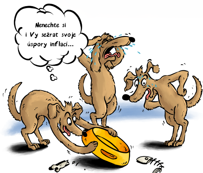
ČÁSTKA NA BĚŽNÉM ÚČTĚ, ČI DOMA 100.000,-

V prvním čtvrtletí roku 2022 se očekává meziroční inflace k 8%, možná až k 10%. Potom ekonomové předpokládají, že by inflace mohla klesat. Pro ochranu financí proti inflaci dnes existuje řada nástrojů. Ať jsou to různé typy dluhopisů, nemovitostní fondy či komodity. Rádi vám v tom poradíme.